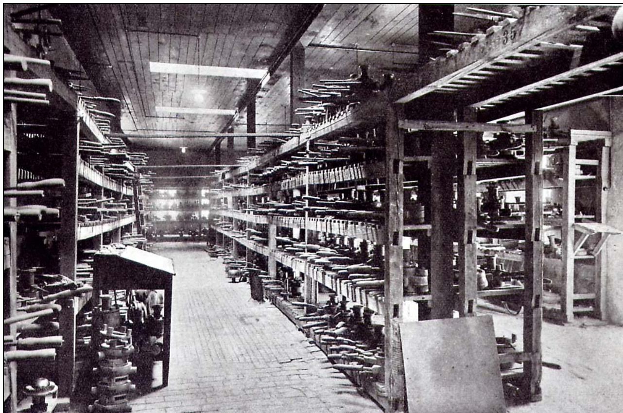
Abb. 2014-1/14-01 Pressglaswerke August Walther & Söhne AG 1 , Ottendorf-Okrilla, Formenlager I im Jahr 1924 aus Festschrift zum 60-jährigen Jubiläum der Fa. August Walther & Söhne 1865-1925, s. PK 2000-3