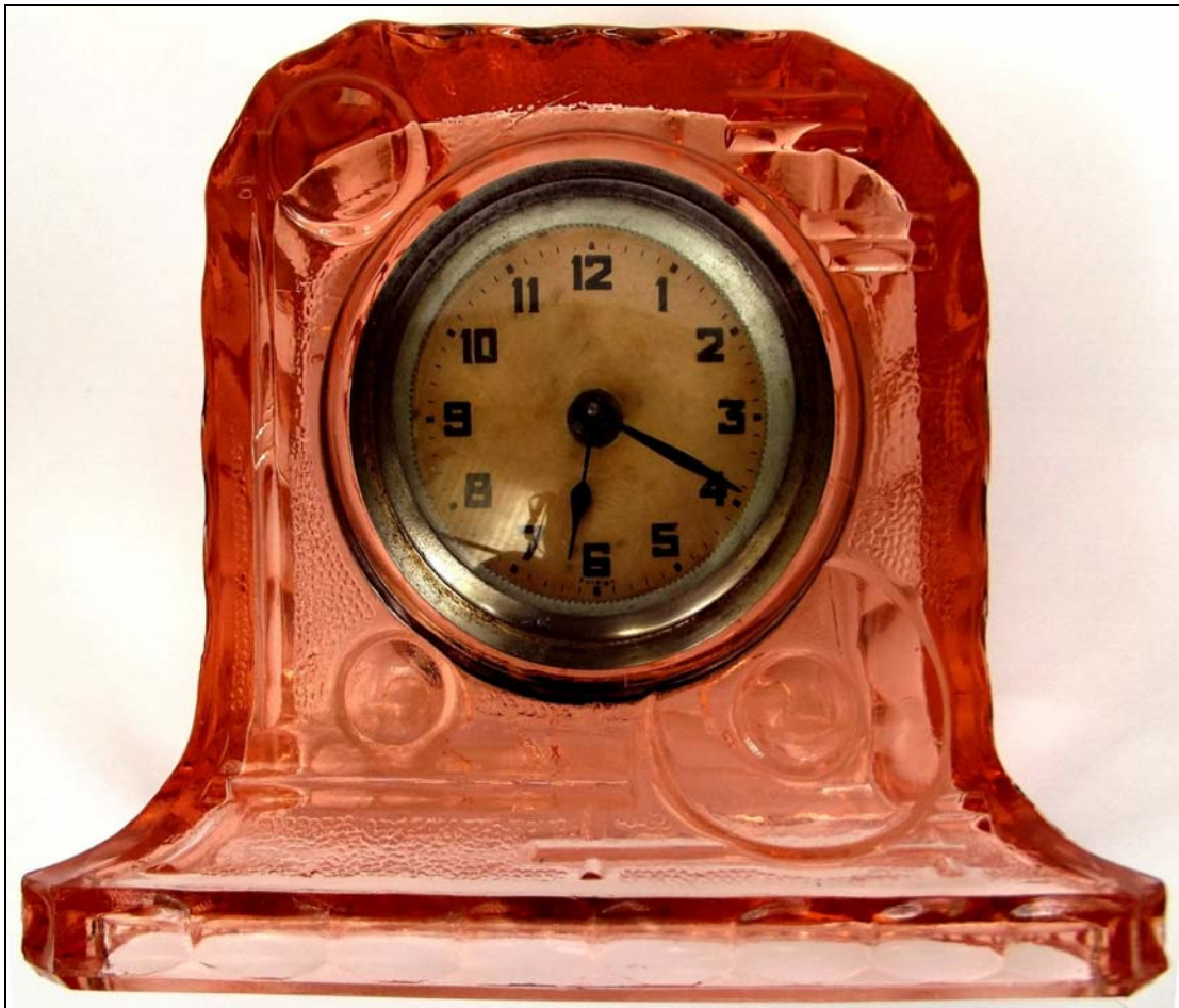
Abb. 2014-2/69-01 (Maßstab ca. 100 %); Tischuhr, rosalin-farbenes Pressglas, H 12 cm, B 14 cm, T 7,2 cm Sammlung Gerlach; s. MB Reich & Co. / Českomoravské sklárny a.s. 1936, Tafel 12, Nr. B 2916