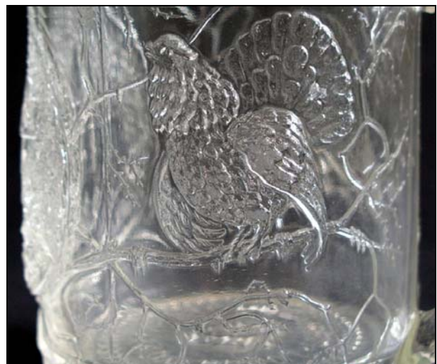
Abb. 2002-4-1/066a Preis-Kurant Preß-Glas Inwald 1914 Biergläser mit Quadrat-Boden, Biergläser gegossen Jägerkanne Nr. 6790 mit „kaiserl. Jagdschloß Mürzsteg“ und zwei Auerhähne, Henkel als Hirschgeweih MB Sammlung CMOG