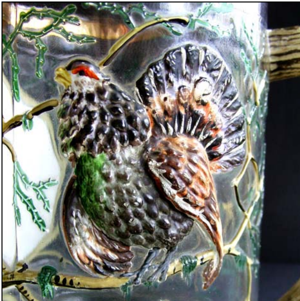
Abb. 2014-2/42-02 Bierkrug mit röhrendem Hirsch und Auerhähnen, farbloses Pressglas, plastisch bunt bemalt, H 12,5 cm, D 9 cm, B mit Henkel ca. 15 cm Sammlung Kuban Inwald AG, Teplitz, Rudolphshütte, 1906-1918 ..., s. Preis-Kurant Preß-Glas Inwald, Teplitz, 1914, Tafel Biergläser, Nr. 6790