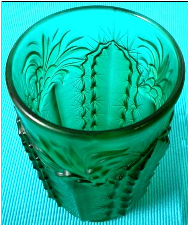
Abb. 2014-2/40-01 Vase mit Kaktusblüten flaschen-grünes Pressglas, außen satiniert. H 19 cm, D 10 cm Sammlung Kuban s. MB Inwald 1934, Tafel 155, Vasen mit Pflanzen und Fischen Nr. 11102

SG: Diese sicher ziemlich seltene Vase kann man mit MB Inwald um 1934 nachweisen! Sie gehört zu der Serie, die „ BAROLAC “ genannt wurde und vor allem Pflanzen und Meerestiere sehr naturalistisch abgebildet hat. Außerdem wurden ungewöhnliche Farben verwendet und die Oberfläche fein satiniert. Viele dieser Gläser haben auch eine eingepresste Signatur „Barolac“. Sie wurden erstmals um 1934 hergestellt und bis 1938 . Nach der Annektion des Sudetengebietes durch das Deutsche Reich 1938 und der radikalen Umstellung der gesamten Industrie auf Kriegswirtschaft wurden solche Gläser nicht mehr hergestellt.