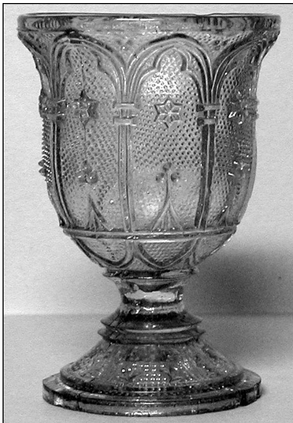
Abb. 2002-4/020 Fußbecher mit neu-gotischen Motiven, gesteinelter Grund farbloses Pressglas, H 11 cm, D 7,4 cm Sammlung Roesse HR-232, Hersteller unbekannt, Frankreich oder Österreich-Böhmen, Mitte bis Ende 19. Jhdt.

Der neu entdeckte Teller ist aber auch verwandt mit einer Familie von Fußbechern, Henkelbechern und Sahnekännchen , die meistens mit einem Neurokoko-Motiv , aber auch mit einem Neugotik-Motiv gemacht wurden. Der Hersteller wird seit Sellner, Glas in der Vervielfältigung 1986 gesucht und konnte bis heute nicht gefunden werden. Er ist eher im Raum Österreich-Böhmen als in Frankreich / Belgien zu suchen. Der Teller könnte geradezu ein Stück aus der Neugotik-Linie sein! Alle bisher gefundenen Gläser dieser Familie haben ungewöhnlich große Produktionsfehler.