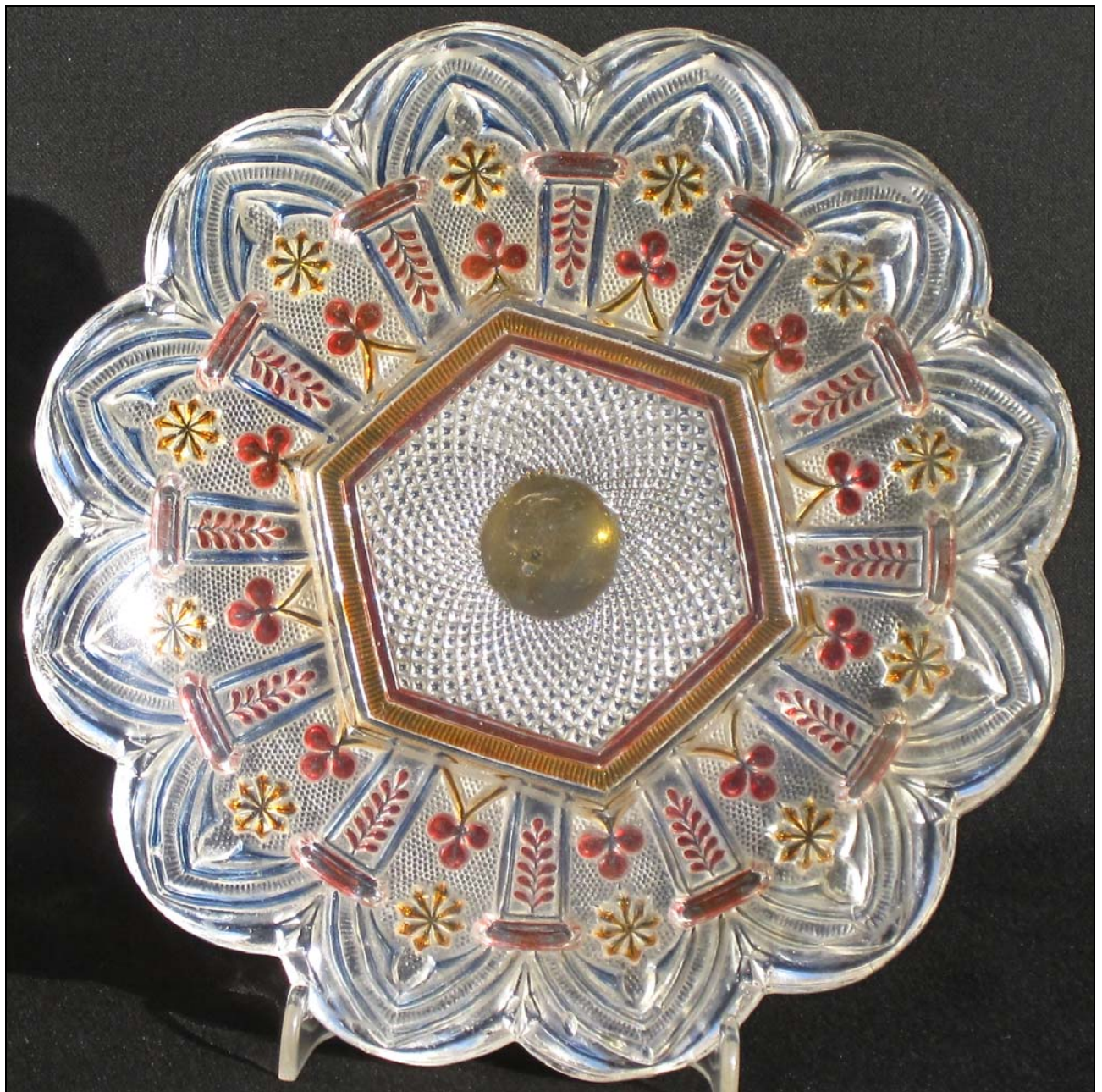
Abb. 2014-2/27-01 (glatte Oberseite) (Maßstab ca. 90 %), Teller mit neu-gotischen Motiven, Diamanten-Spiralen und Sablée farbloses Pressglas, bemalt, H 2,5 cm, D 19 cm, 1 cm dick, ausgeschliffener und polierter Abriss, goldgelb bemalt Sammlung Kuban, vgl. Sammlung Stopfer, PK Abb. 2014-2/35-01

Hersteller unbekannt, Böhmen, um 1850?, Neue Glasrevue 1995-2 , Adlerová: wahrscheinlich Adolfhütte bei Winterberg, um 1850