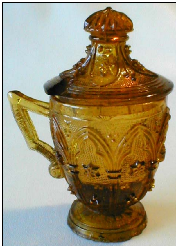
Abb. 2005-2/103 Senftopf mit Henkel und Deckel, Dekor neo-gotisch bernstein-farb. Pressglas, H 11,5 cm mit Deckel, D 5,8 cm Sammlung Vogt vgl. MB Launay, Hautin & Cie. um 1840, Planche 67, No. 2172 S t .L. Moutardier baril m. côtes fines

Die Bemalung des Tellers ist ungewöhnlich. Es muss ein Versuch gewesen sein, solche Pressgläser nachzumachen, der nicht ganz gelungen ist. Auf der Unterseite ist ein goldgelb bemalter, ausgeschliffener und polierter Abriß , D 2,5 cm.