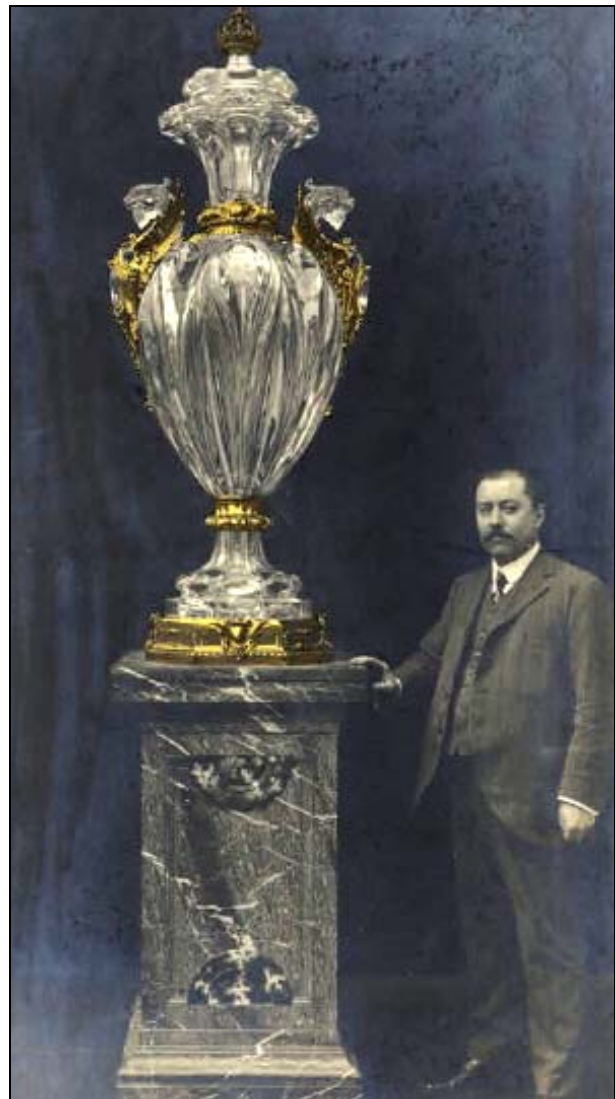
Abb. 2014-3/53-03 Vase dit „du Négus“, 1909 Baccarat, archives de la Manufacture

Geöffnet: Dienstag bis Sonntag von 10 bis 18 Uhr Donnerstag bis 20 Uhr Montag und Feiertage geschlossen Sonderöffnung am 1. und 11. November 2014