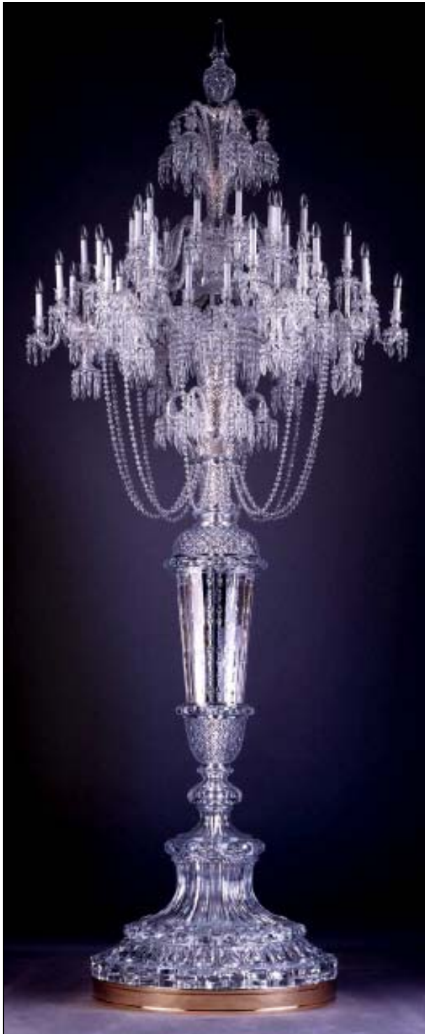
Abb. 2014-3/53-02 Candélabre dit „du Tsar“ commandé pour le tsar Nicolas II en 1896

Präsentiert werden auch außergewöhnliche Werke wie die monumentale „Vase Negus“, die „Toilette der Herzogin de Berry“ oder die „Vasen Simon“, herge-