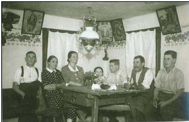
Abb. 2014-3/24-18; aus Saminger, Weißenkirchen, S. 182 Feierabend in der Bauernstube (der Glasmacher?)

Am 14. 3. 1925 erfolgte die erste Lohnauszahlung in Schilling . Der Wochenlohn eines Glasarbeiters betrug 38 S 75 g [Groschen]. Die letzten Kronen waren am 7. 3. ausbezahlt worden.