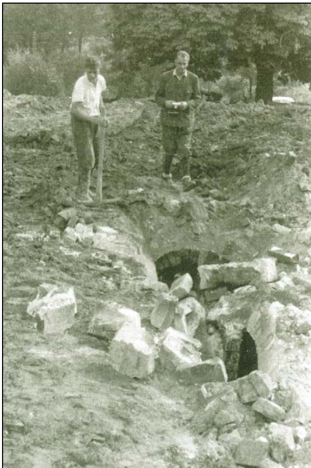
Abb. 2014-3/24-10; aus Saminger, Weißenkirchen, S. 139 Einebnen der Glasöfen 1965

Am 28. Februar 1954 gab es den letzten Poststempel in Freudenthal, weil das Postamt aufgelassen wurde.