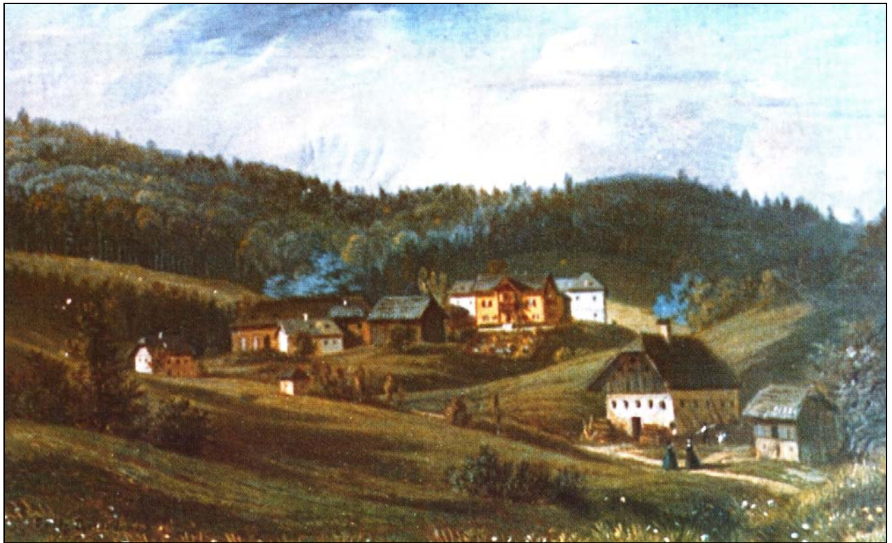
Abb. 2014-3/24-01 Freudenthal in der Mitte des 19. Jahrhunderts; Ölbild im Besitz der Familie Stimpfl-Abele, aus Saminger, Weißenkirchen, S. 137