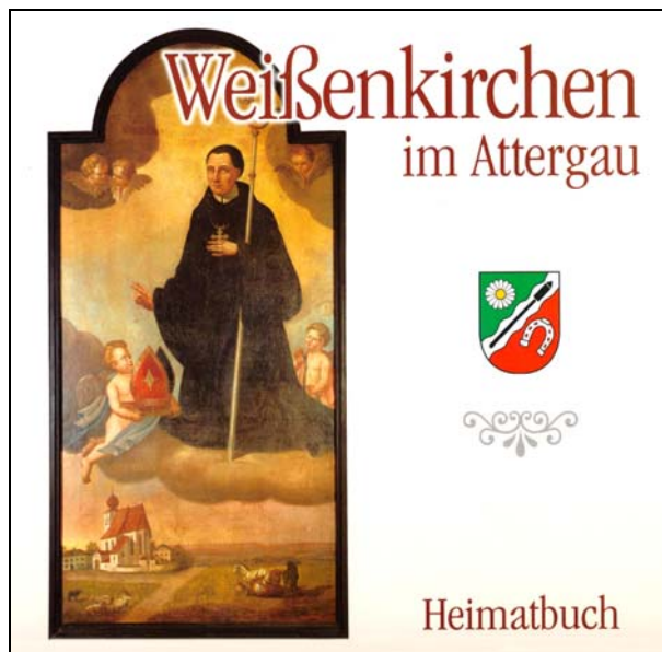
Abb. 2014-3/24-02 Saminger, Heimatbuch der Gemeinde Weißenkirchen im Attergau, Ried 1999, Einband

Herbert Saminger Heimatbuch der Gemeinde Weißenkirchen im Attergau Druck und Verlag Moserbauer, Ried 1999 ISBN 3-900847-56-8