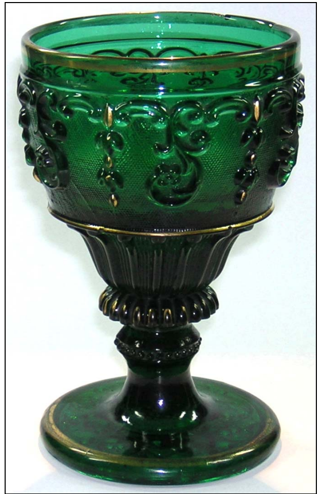
Abb. 2008-1/060 Fußbecher, dunkelgrünes Pressglas, H 11,2 cm, D 8,1 cm Sammlung Vogt PV-246 s. MB Launay, Hautin & Cie. 1840, Planche 78, No. 2432 B. Baccarat, Gobelet à Culot m. à pontils