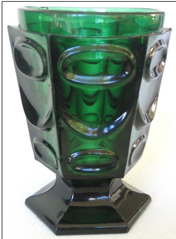
Abb. 2008-1/062 Fußbecher, dunkelgrünes Pressglas, H 12,0 cm, D 8,1,cm Sammlung Vogt PV-247 s. MB Villeroy & Boch um 1898, Tafel 208, Nr. 25

Abb. 2008-1/063 Fußbecher, dunkelgrünes Pressglas, H 12,5 cm, D 8,1 cm Sammlung Vogt PV-248 s. MB Villeroy & Boch um 1898, Tafel 208, Nr. 26