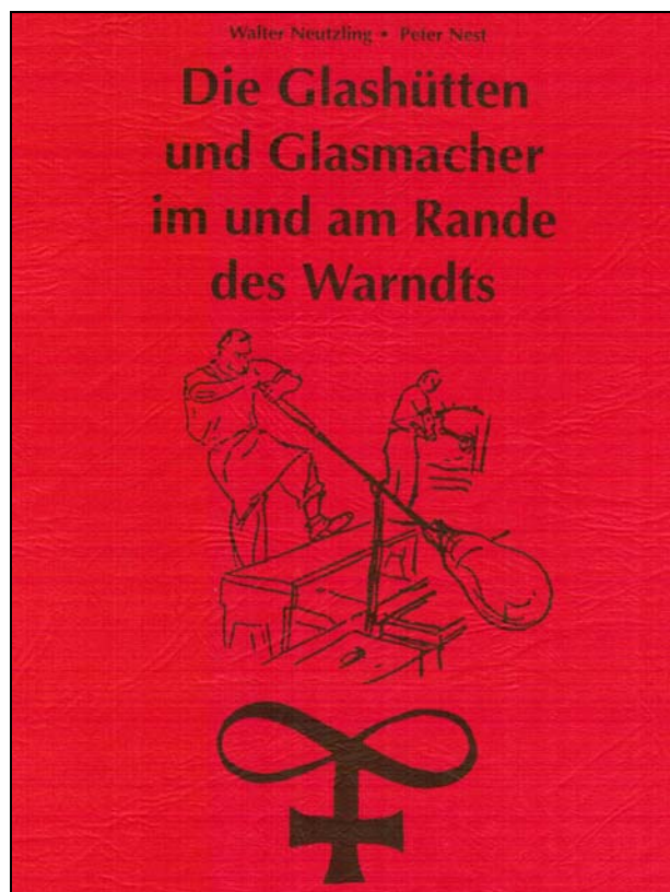
Abb. 2014-1/03-01 Neutzling & Nest, Die Glashütten und Glasmacher im und am Rande des Warndts; 2. verbesserte und erweiterte Auflage 2014 Einband, 191 Seiten, € 19.50