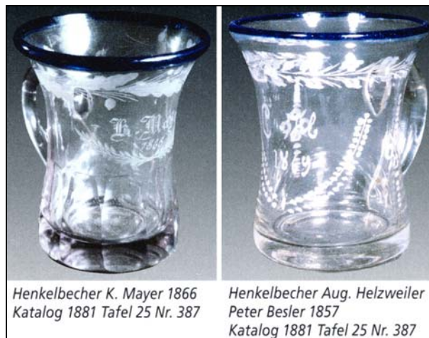
Henkelbecher K. Mayer 1866 Katalog 1881 Tafel 25 Nr. 387

Henkelbecher mit gerutschter Inschrift, datiert 1866 und 1857, beide in MB Fenne 1881, Tafel 25, Becher Nr. 387