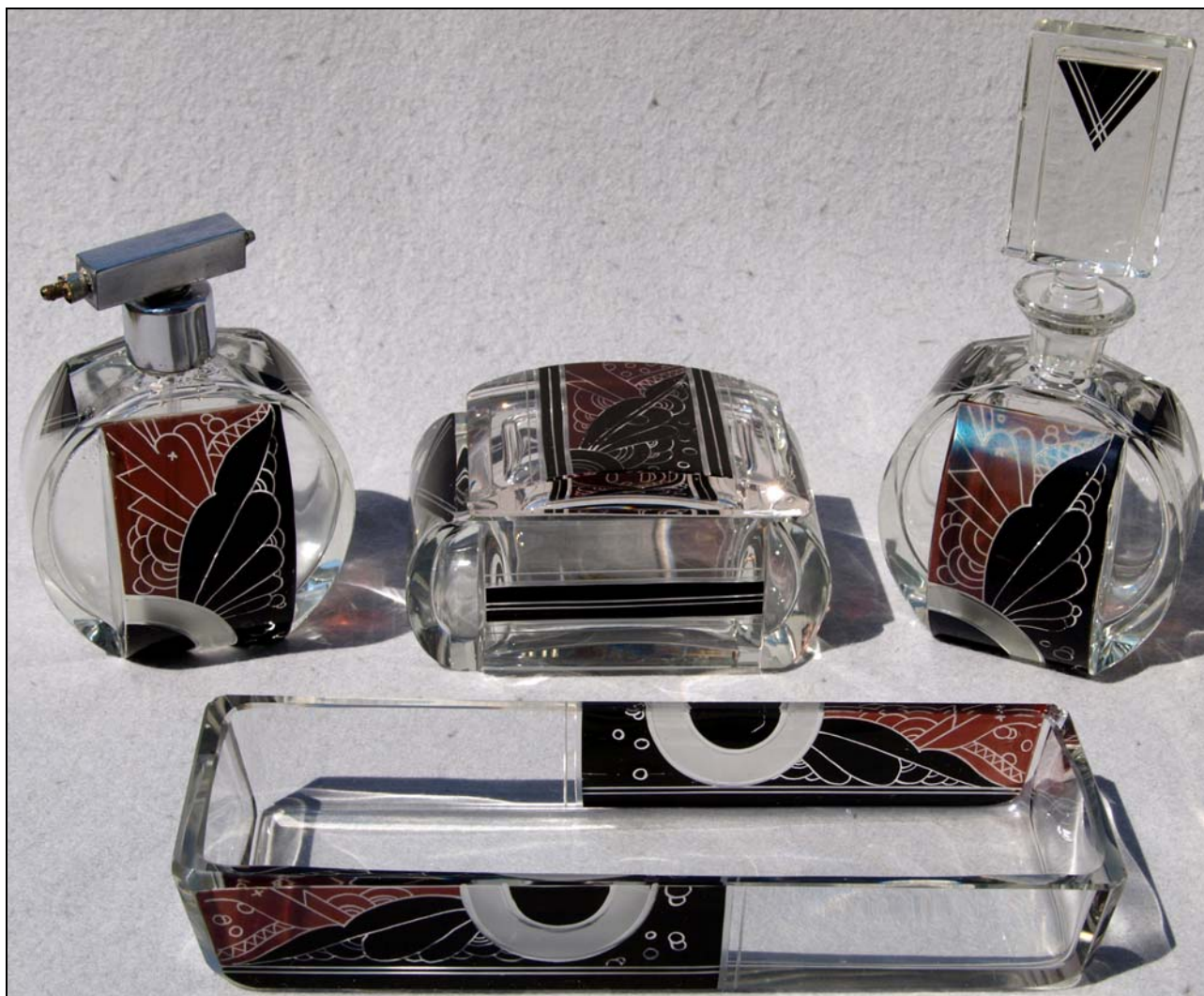
Abb. 2014-3/13-01 (Maßstab ca. 50 %) Vierteilige Art Déco Toilettegarnitur, gepresst, geschliffen, graviert, geätzt, mit schwarzer und kupferbrauner Lasur bemalt farbloses Pressglas, Flakon H 18,5 cm, D 8,5 cm, Zerstäuber H 12 cm, D 8,5 cm, Deckeldose L 12 cm, B 8,5 cm, H 6,6 cm Sammlung Stopfer transparente Aufkleber mit der Aufschrift: „GLASPALDA WIEN, Made in Austria“, Karel (Carl) Palda, Nový Bor / Haida, um 1930