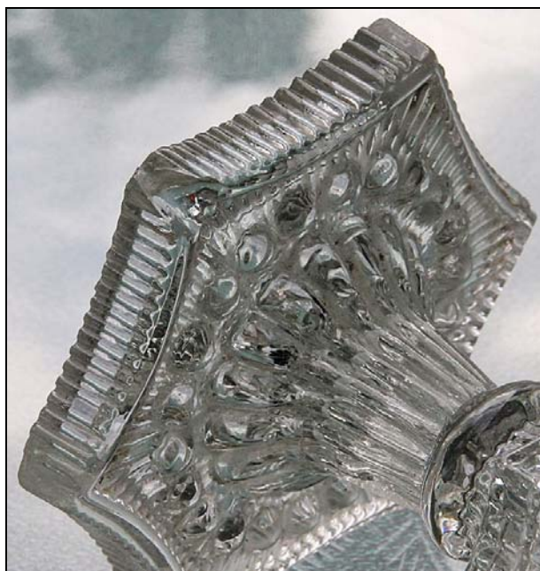
Abb. 2014-4/41-02 eBay DE Art.Nr. 111568872511 (2015-01); 1 Paar Pressglas - Kerzenleuchter Jugendstil um 1920 ... Sie bieten hier auf 1 Paar, Kerzenleuchter original Jugendstil um 1920. [...] reichhaltige Zesilierung [...]. Die Besonderheit liegt in der Strukturbeschaffenheit des Kerzenleuchters - eckig und dennoch prunkvoll präsentiert er sich dem Betrachter. [...] H ca. 21 cm, D oben ca. 5,5 cm, D unten ca. 7,5 x 9 cm, G ca. 340 g SG: Hersteller unbekannt, Böhmen / Mähren oder Steiermark, um 1850, oder Tschechien, um 2014?

Aber die von „eddydrugs“ angebotenen Leuchter sehen auf den Bildern wie neu aus! Man müsste sie anfassen können, um heraus zu bekommen, ob sie alt oder neu sind ... dafür sind sie leider zu teuer ...