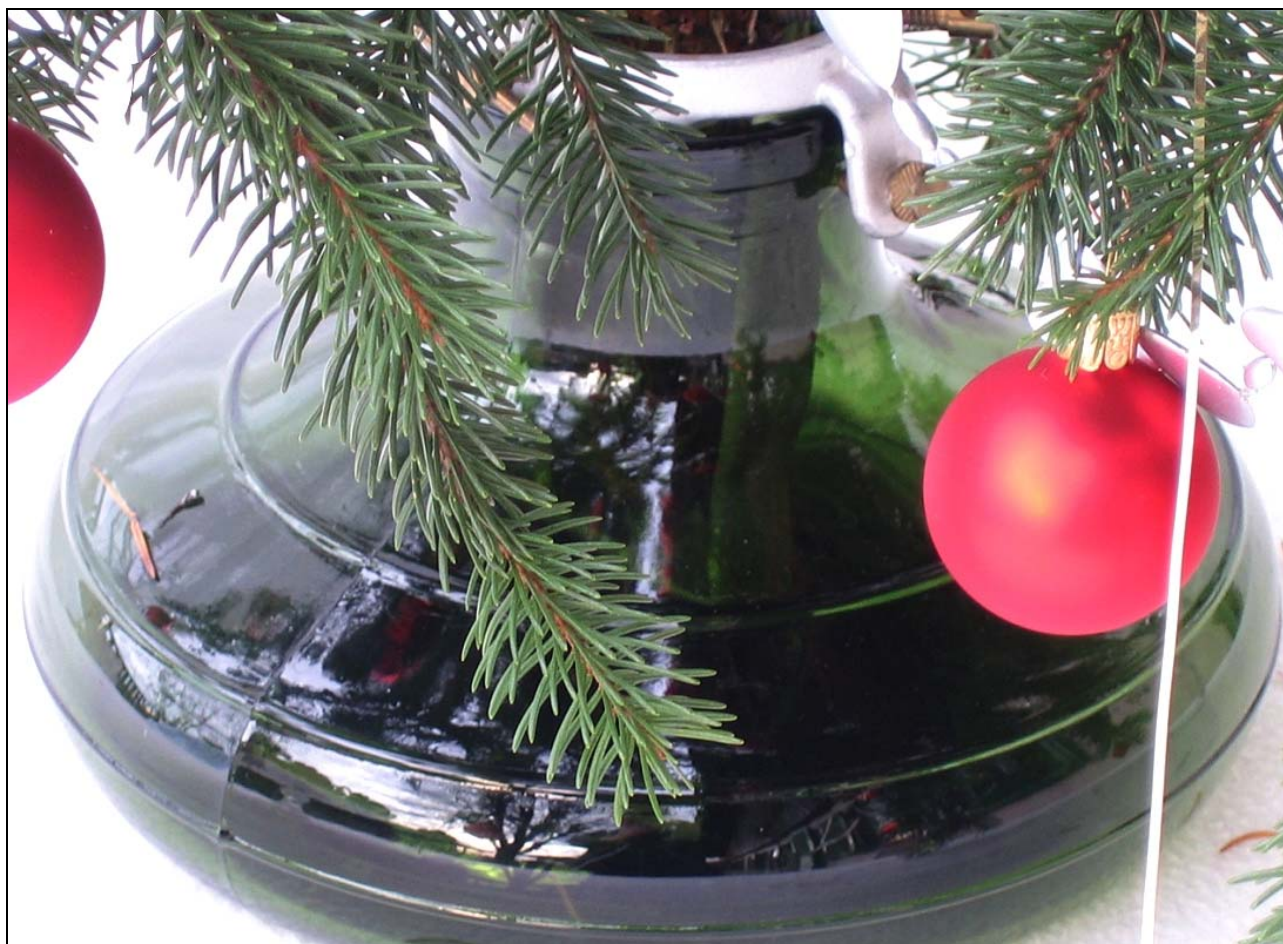
Abb. 2014-4/23-01 Christbaumständer aus grünem Glas, H 13cm, D Boden 22 cm, D Öffnung oben 9 cm Sammlung Jeschke eingepresste Inschrift Beschriftung am Boden: „+ PATENT SCHWEIZ. FABR. SUISSE SWITZERLAND BÜLACH No. 520 +“ Hersteller Bülach, Schweiz, Jahr unbekannt