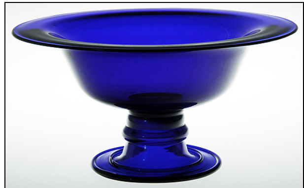
Abb. 26. Karl Rehm, Schale Glasfabrik Theresienthal, um 1915