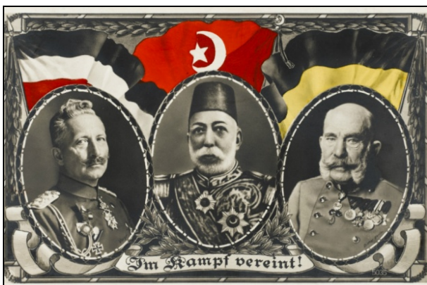
Enver Pascha 1914