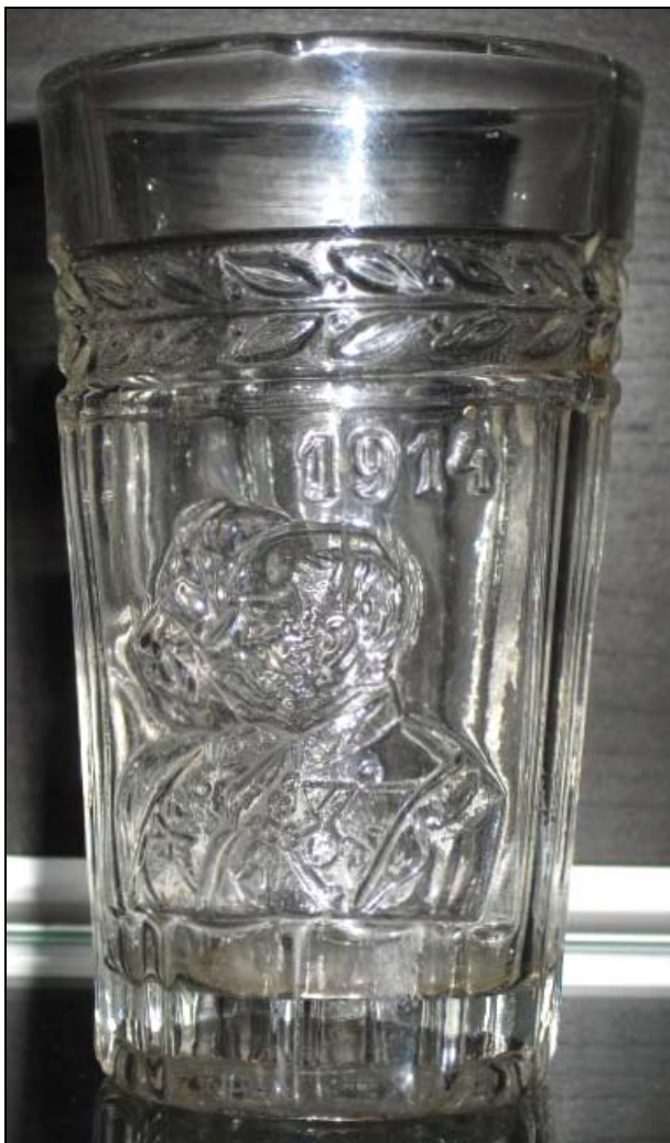
Abb. 2014-4/42-03 Becher mit Bildnis Kaiser Wilhelm II. und Franz Joseph I. unter dem Rand Lorbeerblätter, Aufschrift „1914“ farbloses Pressglas, H ??? cm, D ??? cm Hersteller unbekannt, Deutschland, Böhmen?, 1914 aus http://militaria14all.skyrock.com