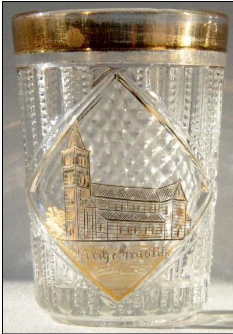
Abb. 2002-4/104 Becher mit Bild einer Klosterkirche eingepresste Inschrift „MUTTERGOTTESBERG“ Gebäude und Rand vergoldet farbloses Pressglas, H 9,1 cm, D 5,9 cm s. Preis-Kurant Pressglas Inwald 1914, Nr. 6027 und 6114

Abb. 2005-1/306 Becher, graviert Bild einer Kirche und Inschrift, „Kirche Graslitz“, senkrechte Rillen mit Punkten, im Quadrat Diamanten farbloses Pressglas mit Vergoldung, H 9,9 cm, D 7,1 cm Glasmuseum Passau (ehem. Sammlung SG PG-870) vgl. Preis-Kurant Pressglas Inwald 1914, Tafel „Becher“, Nr. 6120, „Walzen und Perlen“