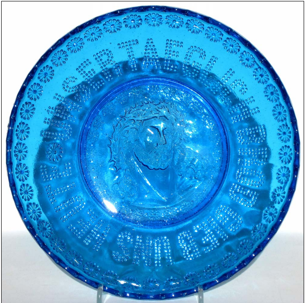
Abb. 2014-4/26-01 (Maßstab ca. 70 %)

Brotteller mit Rosetten, im Boden Christus-Kopf mit Dornenkrone