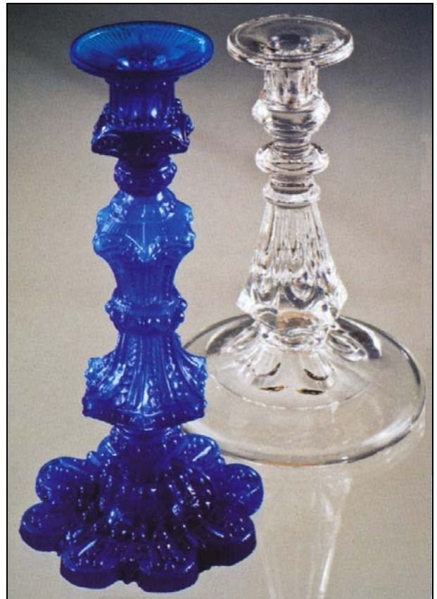
Abb. 2013-1/03-36, AK Horácku, Polička 2009, S. 41 Kerzenleuchter [Svícen], H 24 cm, Inv.Nr. Hs 21 (links) H 20,5 cm, Inv.Nr. Hs 443 (rechts) Milovy, 60-er - 80-er Jahre 19. Jhdt.