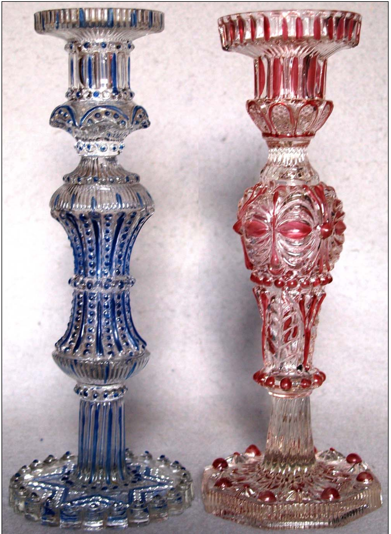
Abb. 2014-4/33-01 (Maßstab ca. 85 %)

Kerzenleuchter, form-geblasenes, farbloses Glas, blau bzw. rot bemalt, blau H 27 cm, rot H 26,4 cm aus drei Teilen zusammengesetzt: Kerzentülle und Fuß gepresst, Mittelteil in die Form fest geblasen