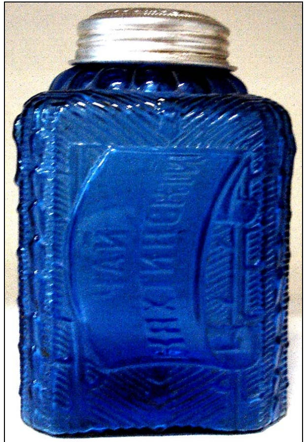
Abb. 2013-1/34-06 Teedose mit russisch-kyrillischer Inschrift form-geblasenes kobalt-blaues Glas, H ohne Deckel 13,2 cm, B x B 7,5 cm Inschrift „ ЧАЙ КЯХТИНСКИЙ “ [Kyakhtinskaya Tee] Sammlung Staatl. Museum Wladimiro-Susdal, Inv.Nr. B-20810 Hersteller unbekannt, Russland, vor 1900

Kyakhta / Кяхта / Kjachta, Stadt in der Republik Burjatien (Russland), südlich vom Baikalsee an der Grenze zur Mongolei. Als Gründungsjahr von Kjachta gilt 1727 , als hier der erste Vertrag von Kjachta zwischen dem Russischen Reich und dem Kaiserreich China unterzeichnet wurde, der den Grenzverlauf südlich des Baikalsees und den Grenzhandel zwischen beiden Staaten regelte. [...]. 1728 , entstand etwas weiter nördlich, näher an den Ausläufern des Selengegebirges, zum Schutz des Handelsweges die Festung Troizkosawsk [...]. Mindestens bis zur Mitte des 19. Jahrhunderts behielt Kjachta-Troizkosawsk seine Bedeutung als wichtigstes Handelszentrum an der Grenze zu China. [...]