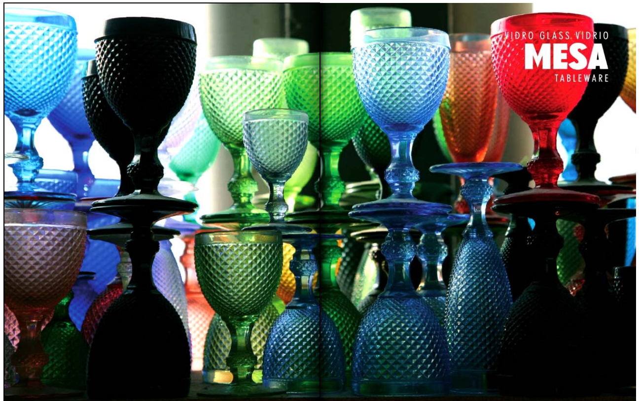
Abb. 2013-2-02/01, MB Atlantis 2009, Seite 174-175, Mesa / Tableware, www.youblisher.com/p/133672-Catalogo-Trade-Atlantis