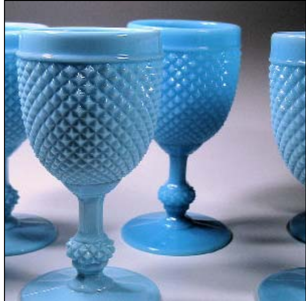
Abb. 2013-2-02/02 MB Atlantis 2009, Einband www.youblisher.com/p/133672-Catalogo-Trade-Atlantis

Abb. 2007-4/363 eBay DE, Art.Nr. 170147738080, € 38,50 „6 große Pressglaspokale blau aus Portugal ...“ H 17 cm, D 8 cm eBay DE, Art.Nr. 170147734337, € 28,60 „6 kleine Pressglaspokale blau aus Portugal ...“ H 15 cm, D 7,5 cm SG: Hersteller wahrscheinlich IVIMA, Portugal (ab 2000 Atlantis, Portugal)