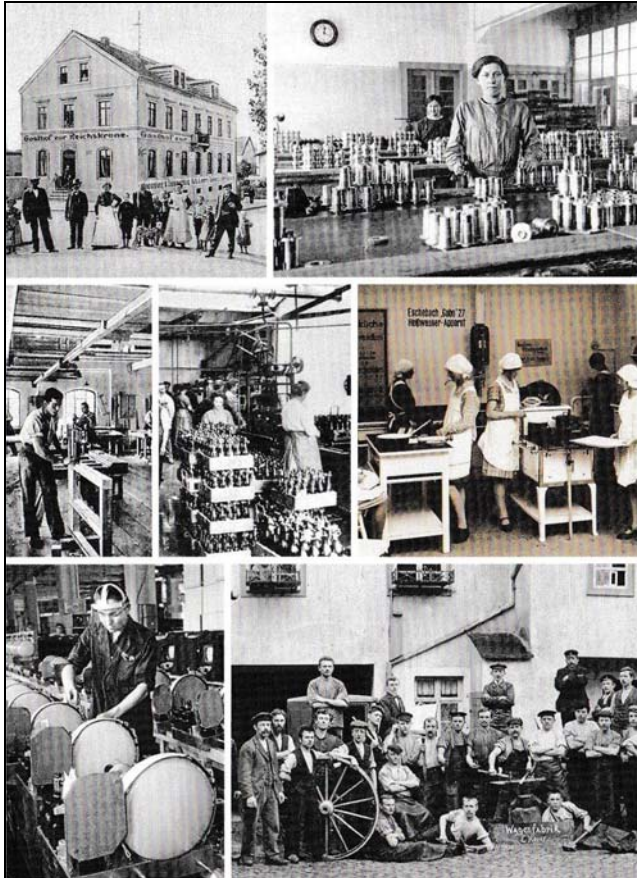
Abb. 2015-1/53-02; Flyer zur Ausstellung (Vorder- und Rückseite)