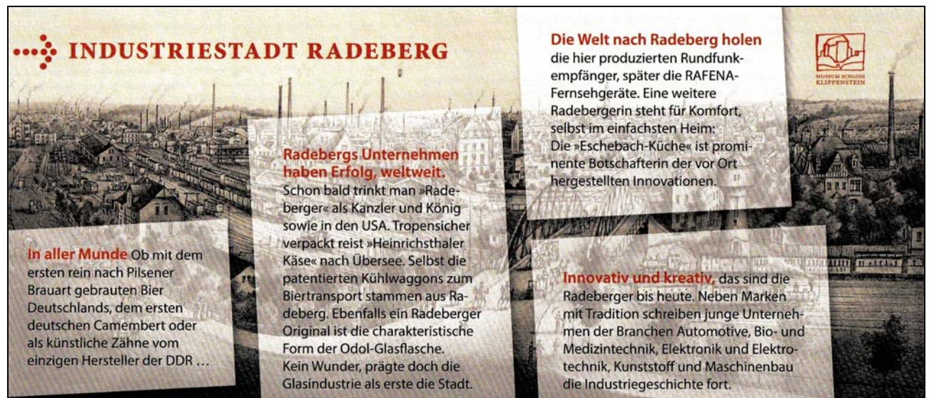
Abb. 2015-1/53-03; Flyer zum Eröffnungswochenende

Geöffnet: Sommerzeit: Die-Fr 9-i2 u. 13-17 Uhr Sa, So, Feiertage: 11-17 Uhr Winterzeit: Die- Fr 9-12 u.13-16 Uhr Sa, So, Feiertage: 11-17 Uhr