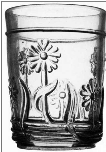
Abb. 2015-1/62-03, Foto Peltonen Becher „Iris“ mit Blumen-Motiven, farbloses Pressglas Sammlung Peltonen Entwurf und Formenmacher Alfred Gustafsson Glasfabrik Iittala, Schweden

Die Ausstellung in Eda, beinhaltet u.a. Glasobjekte inklusive einer Originalform aus Gusstahl. Diese Form ist vom Finnischen Glasmuseum Riihimäki ausgeliehen.