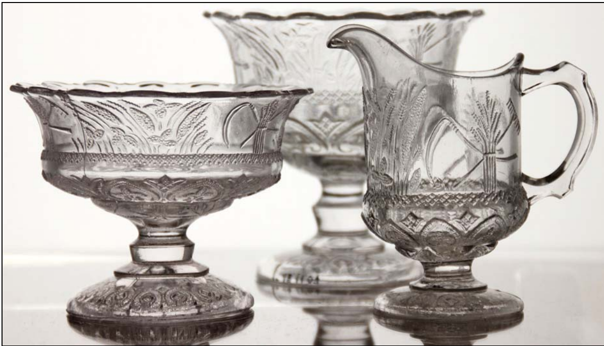
Abb. 2015-1/62-01, Foto Peltonen Fußschalen und Henkelbecher „Ceres“ mit landwirtschaftlichen Motiven, farbloses Pressglas, Sammlung Peltonen Entwurf und Formenmacher Alfred Gustafsson, Glasfabrik Iittala, Schweden