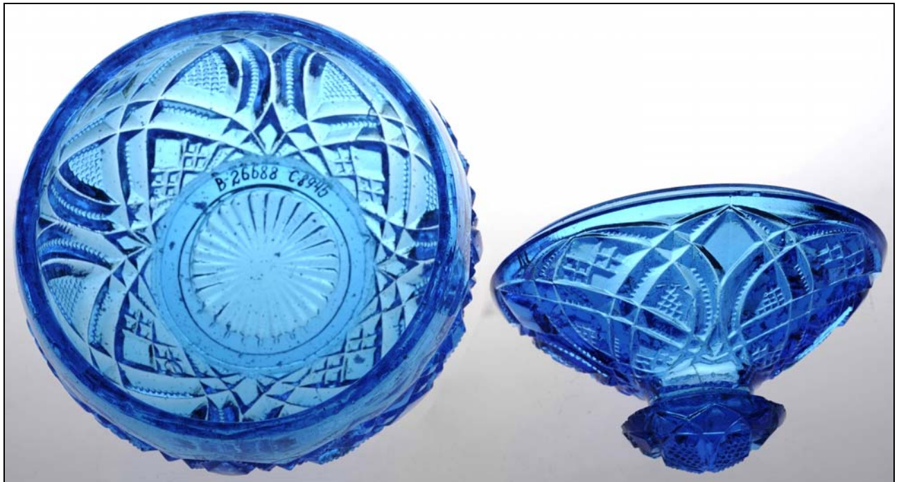
Abb. 2015-1/30-01 (Maßstab ca. 75 %)

Zuckerdose mit Pseudo-Schliffmuster, blaues Pressglas, H 15 cm, D 11,5 cm