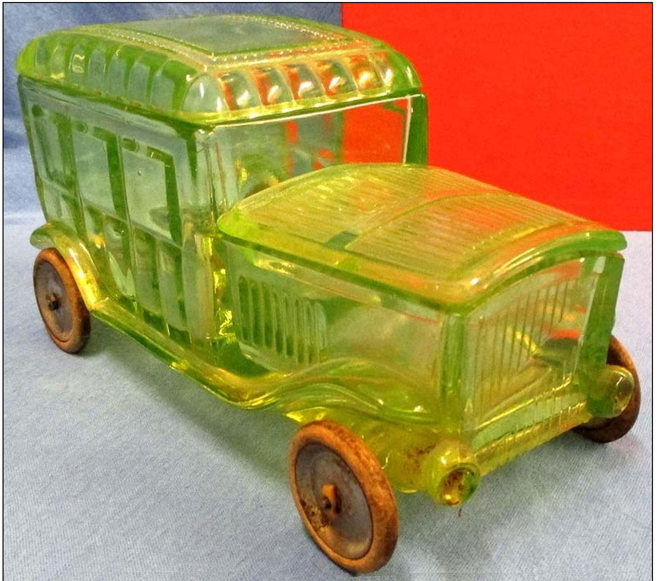
Abb. 2015-2/45-01 Limousine aus uran-grünem Pressglas, H 10 cm, B 9 cm, L 20 cm im Boden eingepresst: „D.R.G.M. Nr. 1068431“, „Made in Germany“ und Krone mit Kreuz & SG Sächsische Glasfabrik Radeberg, um 1928 eBay DE, Art.Nr. 161751622241, sofort kaufen € 350 (2015-08-12)