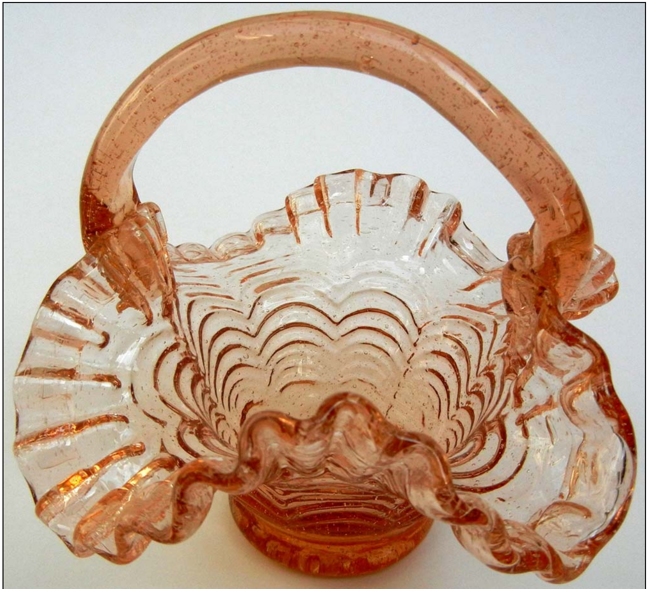
Abb. 2015-2/16-01 (Maßstab ca. 150 %) Körbchen mit „Draperies“, Rand gefaltet und gezwickt, Abriss roh belassen, rosa-farbenes, form-geblasenes Glas, H 12 cm, B 13,5 cm Sammlung Reith Hersteller unbekannt, um 1850