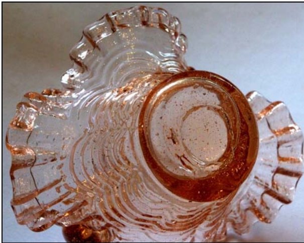
Abb. 2015-2/16-02 Körbchen mit „Draperies“, Rand gefaltet und gezwickt, Abriss roh belassen, rosa-farbenes, form-geblasenes Glas H 12 cm, B 13,5 cm Sammlung Reith Hersteller unbekannt, um 1850

Solche Körbchen wurden sicher vor allem für Jahrmärkte oder für Glasträger gemacht, wo ein Jüngling seiner Angebeteten etwas Hübsches schenken wollte, aber eben nicht viel Geld hatte ... Da kam es nicht darauf an, wie der Boden aussieht, sondern dass das Geschenk hübsch aussieht ... und einem geschenkten Körbchen, schaut frau nicht unter den Boden!