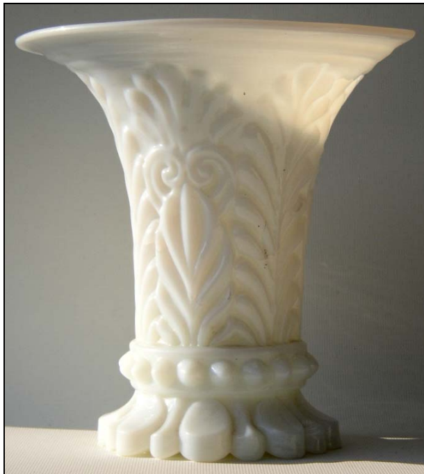
Abb. 2005-4/017 Jasmin-Vase mit Palmetten und Blättern form-geblasenes opak-weißes Glas, H 14,4 cm, D 14,5 cm auf dem Boden runde Scheibe mit ausgekugeltm Abriss Sammlung SG PG-957 Hersteller unbekannt, Frankreich, um 1840

Abb. 2007-4/065 rechts Jasmin-Vase mit Flechtbändern [vase à violettes à motif de tresses en cristal bleu moulé] kobalt-blaues, form-geblasenes Glas, H 13,3 cm „Hersteller unbekannt, Frankreich, um 1840“ aus Auktionskatalog Boisgirard & Associates, Paris, April 2007, S. 38 f., Nr. 301 s. PK Abb. 2005-4/020