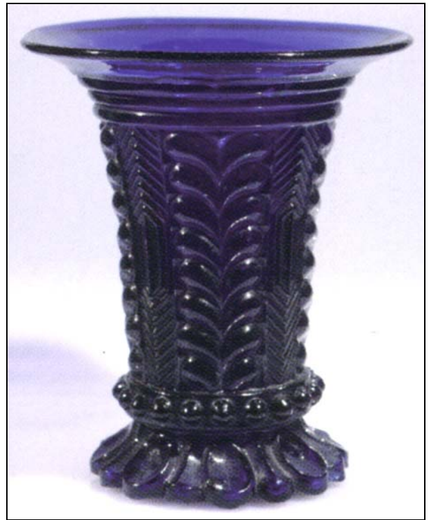
Abb. 2005-4/020 Jasmin-Vase mit Blättern, Sechsecken und Winkeln form-geblasenes, opak-blaues Glas, H 15,6-16,0 cm, D 12,8 cm auf dem Boden runde Scheibe mit roh belassenem Abriss Sammlung SG PG-969 Hersteller unbekannt, Frankreich, um 1840

Es sieht so aus, als hätte man bei der opak-weißen Vase PG-957 erst einmal einen solchen spiralig verdrehten Boden ausprobiert: ungleich breite Rippen, nur leicht gegen den Uhrzeigerseiner verdreht , nur wenige Beschädigungen.