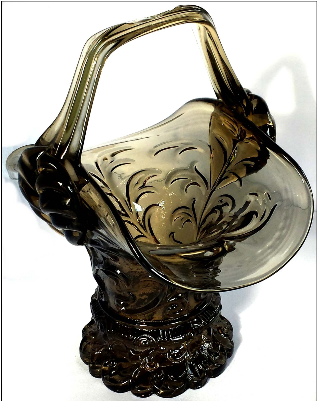
Abb. 2015-3/01-01 (Maßstab ca. 100 %) Körbchen mit Ranken und aufgeschmolzenem Blatt, Fußring mit Perlen und Winkeln, Boden mit Spirale, Abriss form-geblasenes, anthrazit-farbenes Glas, H mit Griff 20 cm, H ohne Griff 9,5 cm, D 15,5 x 10,5 cm Sammlung Boschet, erworben Flohmarkt Homburg / Saar 2015 Hersteller unbekannt, Frankreich?, um 1825-1850?