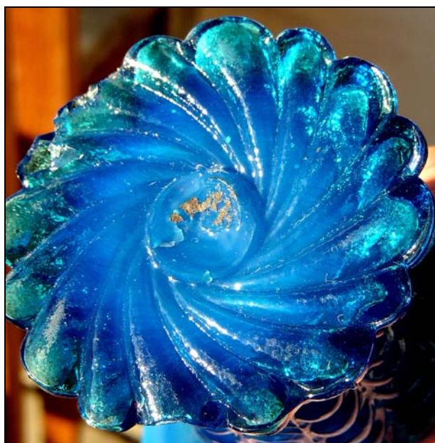
Abb. 2008-3/094 Jasmin-Vase mit Palmetten und Ranken, Grund Sablée Fuß mit spiralig verdrehten Rippen auf dem Boden runde Scheibe mit roh belassenem Abriss opalisierendes, opak-weißes, form-geblasenes Glas H 17,1 cm, D Rand ca. 13,6 cm, D Fuß ca. 8,7 cm Sammlung SG PG-1119 Hersteller unbekannt, Frankreich, Belgien, um 1830-1840?