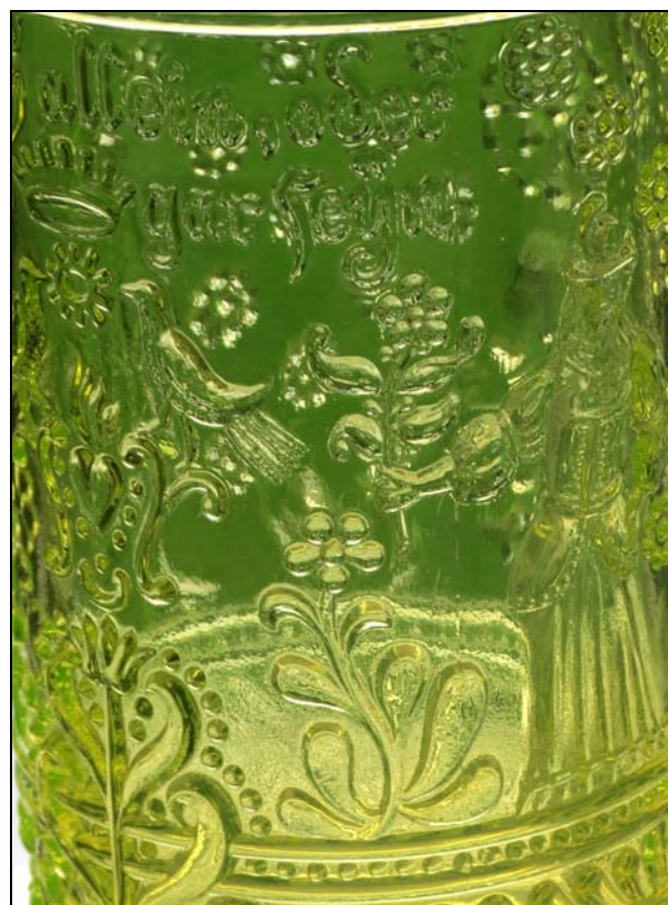
Abb. 2015-3/47-01 eBay DE, Art.Nr. 391326661556 (Stand 2012-12) Uran-gelber Becher mit Bildern und Spruch opak-weiße Anlauffarbe, H 12,5 cm, D 7 cm Hersteller unbekannt, Deutschland?, Böhmen, vor 1900?