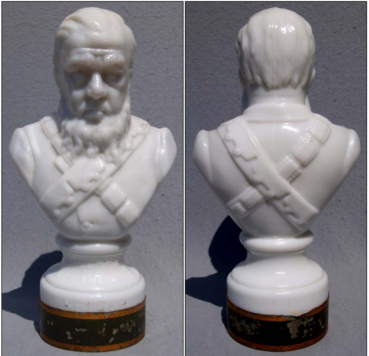
Abb. 2015-3/08-01 (Maßstab ca. 45 %) Büste „Paul Kruger“, press-geblasenes, opak-weißes Glas, H mit Sockel 33,5 cm, D Sockel 11 cm auf dem Sockel eingepresste und ehemals bemalte Inschriften „GUERRE AUX TYRANS!“ und „KRUGER“ Sammlung Stopfer wohl Legras & Cie., Verreries et Cristalleries St. Denis, um 1900