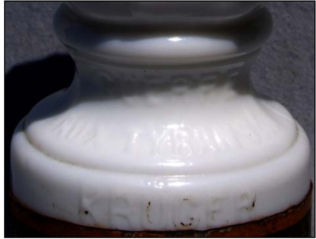
Abb. 1999-3/056 Flaschen mit Zar Nicholas II. und Zarin Alexandra Feodorovna (Zar Nicholas II., reg. 1894-1917, Hochzeit 1894) opak-weißes, press-geblasenes Glas, H 26,7 cm aus Chiarenza, Milk Glass Book, 1998, S. 20, Abb. 12a u. b Legras & Cie., Verreries et Cristalleries de St. Denis Musterbuch Legras 1908, Nr. 1104 und 1105, „Czar et Czarine“ s. Michel, Legras Verrier, 2002, S. 122, 127, 254

Abb. 2015-3/08-02 Büste „Paul Kruger“, press-geblasenes, opak-weißes Glas, H mit Sockel 33,5 cm, D Sockel 11 cm auf dem Sockel eingepresste und ehemals bemalte Inschriften „GUERRE AUX TYRANS!“ und „KRUGER“ Sammlung Stopfer wohl Legras & Cie., Verreries et Cristalleries St. Denis, um 1900