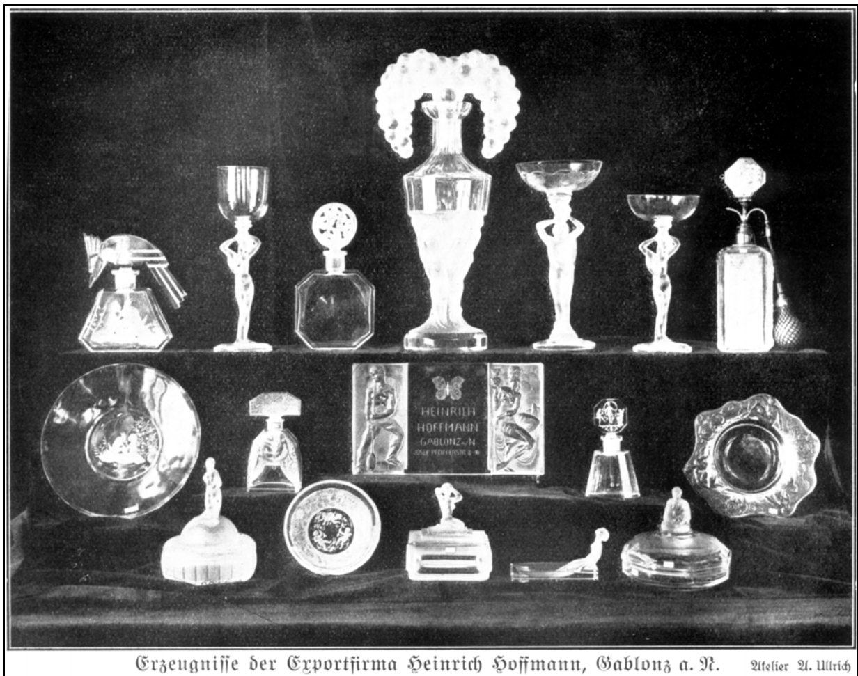
Abb. 2007-1-01/018; Fotografien / Bilder Hoffmann, Gablonz, um 1930 ; Sammlung Muzeum skla a bižuterie v Jablonci nad Nisou Gläser, Mitte „Jardiniere Tanzende Putten“, s. MB Hoffmann 1927/1930, Tafel 46, Nr. 415 links Karaffe, Stopfen mit Trauben, s. MB Hoffmann 1927/1930, Tafel 45, Nr. 429 rechts Kerzenhalter, s. MB Hoffmann 1927/1930, Tafel 42, Nr. 412