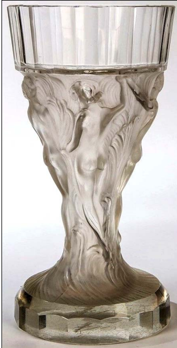
Abb. 2018-1/73-06 (Maßstab ca. 80 %) Pokal / Vase, farbloses Pressglas, H 22 cm, D Rand ??? cm nachgeschliffen, poliert, satiniert https://www.pinterest.de/pin/490540584408235331 im Boden Nadelätzung „Hoffmann“ s. MB Hoffmann 1930, Tafel 44, Nr. 447