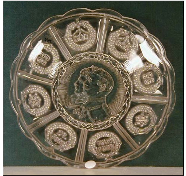
Abb. 2000-5/085 Andenken-Teller Doppel-Bildnis Kaiser Wilhelm II. und Kaiserin Auguste Viktoria sowie 8 Kinder Sammlung Museum für Glaskunst Lauscha farbloses Pressglas, D ??? cm, Inschriften „25“, 8 Relief-Bilder Hersteller unbekannt, Deutschland zur Silberhochzeit des Kaiserpaars am 27. Februar 1906