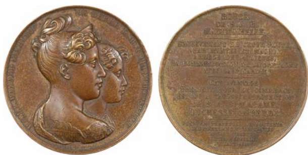
Abb. 2018-1/53-17 Duchesse de Berry / Duc de Bordeaux, nach 1827 HENRI. CH. FERDINAND DIEUDONNÉ DUC DE BORDEAUX Bronzemédaille, D 51 mm, E. Dubois Ft 1827