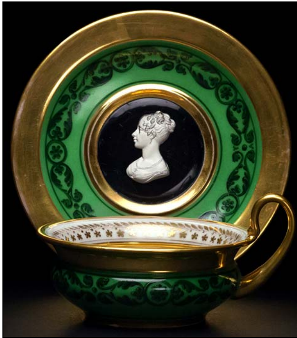
Abb. 2018-1/53-24 Pasten-Portrait Duchesse de Berry, Teller einer Tasse xxx cristallo-c ramie signiert „DESPREZ“