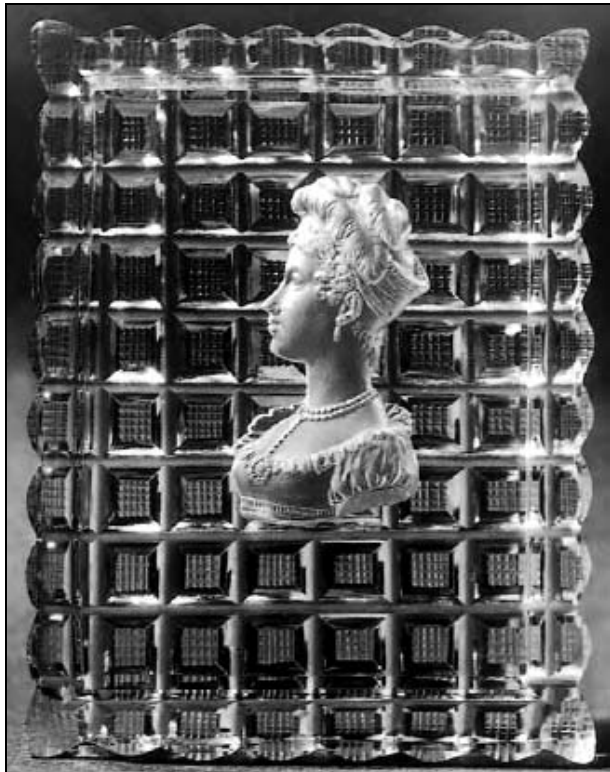
Abb. 2005-2/268 Rechteckige Plakette Duchesse de Berry Signatur Acloque fils, Paris Sammlung Musée des Arts décoratifs, Bordeaux aus Jokelson 1968, S. 52, Fig. 45 s.a. Pasquier, Jeanvrot 2005, S. 57