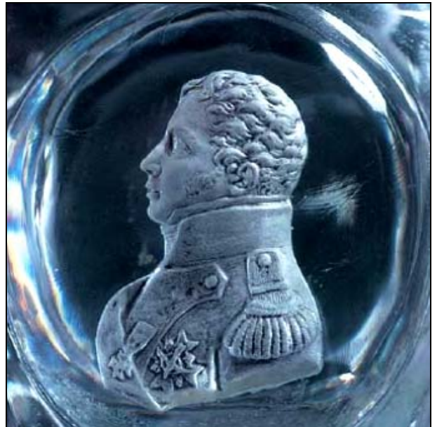
Abb. 2018-1/53-26 Pasten-Portrait Duc de Berry, m dailleon Paire de vases en cristal taill , de forme ovoide dite «pointe en bas », aux profils du duc et de la duchesse de Berry. Entre 1816 et 1820. (H 35,5 cm; H / D du m dailleon 5,5 cm. Collection priv e aus Pasquier, Jeanvrot, 2005, S. 62-63 [cristallo-c ramies nicht signiert]