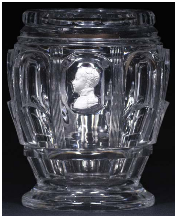
Abb. 2018-1/53-27 Pot en cristal taillé à deux rangs de festons, filets et côtes plates, orné du profil gauche du duc de Bordeaux . H 16 cm Bercy?, Frankreich, 1830 (Restauration) www.ader-paris.fr 2013, Lot 193