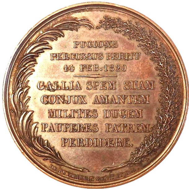
Abb. 2018-1/53-04 CH. FERDINAND DUC DE BERRY 1820 (zur Ermordung) Portrait nach links, Bronzemedaille, D 40 mm; GAYRARD F. 1820 , Rückseite PUYMAURIN FECIT ET DIR.

PUGIONE PERDUSSUS PERIIT / 14. FEB. 1820 GALLIA SPEM SUAM / CONJUX AMANTEM / MILITES DUCEM / PAUPERES PATREM / PERDIDERE