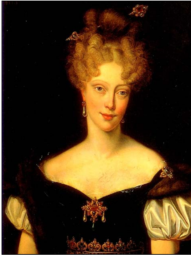
Abb. 2005-2/268 Rechteckige Plakette Duchesse de Berry Signatur Acloque fils, Paris Sammlung Musée des Arts décoratifs, Bordeaux aus Jokelson 1968, S. 52, Fig. 45 s.a. Pasquier, Jeanvrot 2005, S. 57