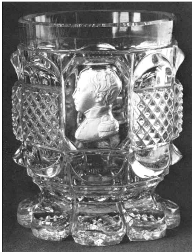
Abb. 2018-1/53-27 Pot en cristal taillé à deux rangs de festons, filets et côtes plates, orné du profil gauche du duc de Bordeaux . H 16 cm Bercy?, Frankreich, 1830 (Restauration) www.ader-paris.fr 2013, Lot 193