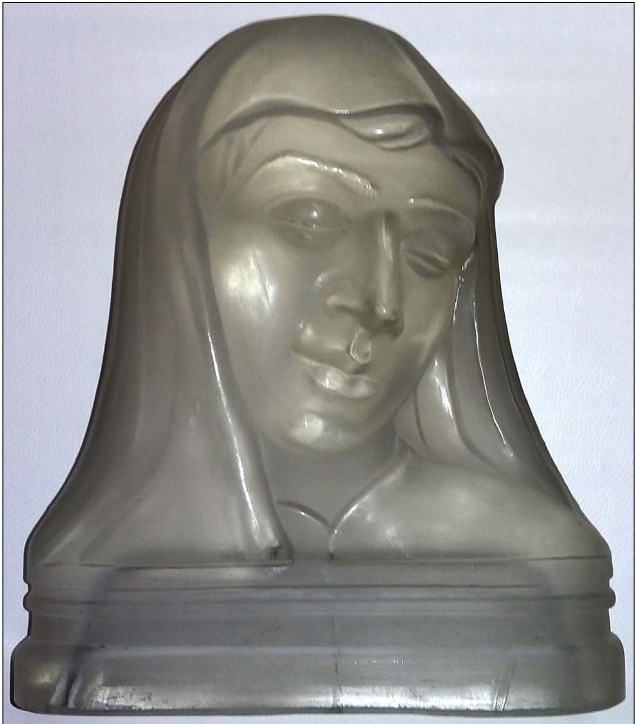
Abb. 2019/78-01 (Maßstab ca. 80 %)

Madonna-Büste, farbloses Pressglas, mattiert / poliert, H 23 cm, B 20 cm, T 5,7 cm