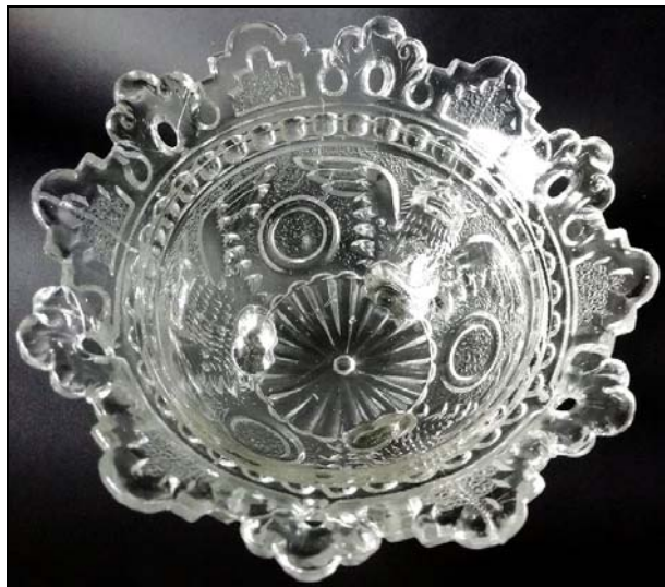
Abb. 2019/55-02 Zuckerdose mit 3 Füßen und Fratzen von Löwen (?) zwischen Flügeln farbloses Pressglas, unregelmäßig gekörnt, H 15 cm, D 14 cm Sammlung Groß Hersteller unbekannt, Frankreich?, vor 1900?