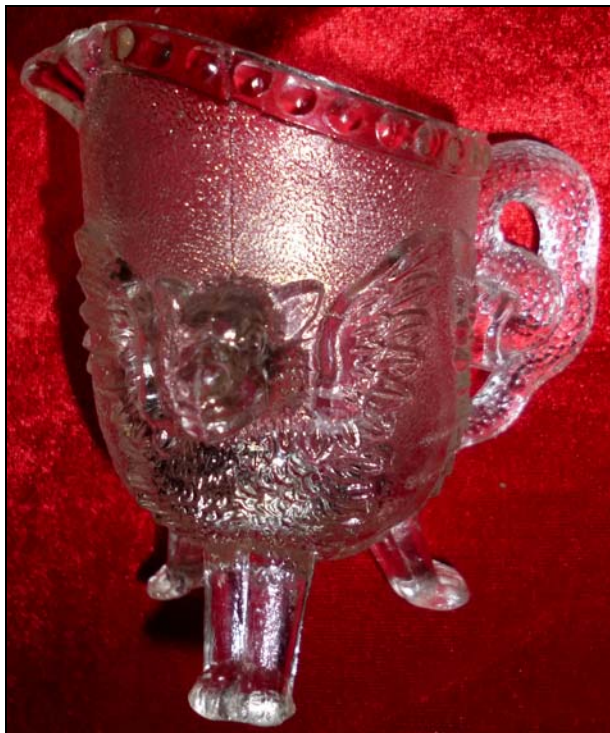
Abb. 2015-3/39-01 Milchkännchen mit drei Löwenköpfen, farbloses Pressglas, unregelmäßige Körnung, Rand mit großen Perlen, H ca. 9 cm Sammlung Groß Hersteller unbekannt, England, 1890?