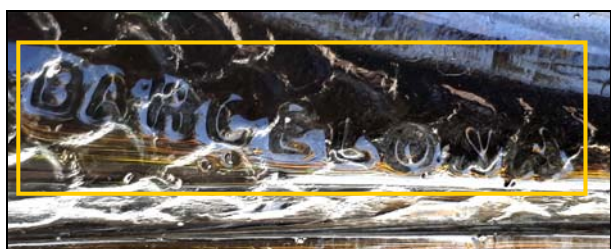
Abb. 2019/69-02 (Ausschnitt) Muschel-förmige Schalen mit Rippen und Schuppenmuster, farbloses Pressglas, H 3 cm, B max 13 cm, L 22 cm Sammlung Jeschke gemarkt „LLIGE Y C A “ und „BARCELONA“ Fábrica de cristal Lligé, Barcelona, Cristalerías San Miguel, Spanien, um 1900

Die Fábrica de cristal Lligé, Cristalerías San Miguel, Barcelona , hat nur bis um 1900 bestanden.