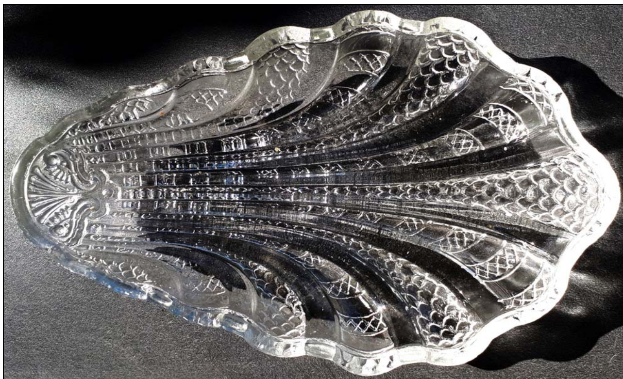
Abb. 2019/69-01 (Maßstab ca. 75 %) Muschel-förmige Schalen mit Rippen und Schuppenmuster, farbloses Pressglas, H 3 cm, B max 13 cm, L 22 cm Sammlung Jeschke, gefunden in Madrid gemarkt „LLIGE Y C A “ und „BARCELONA“ Fábrica de cristal Lligé, Barcelona, Cristalerías San Miguel, Spanien, um 1900