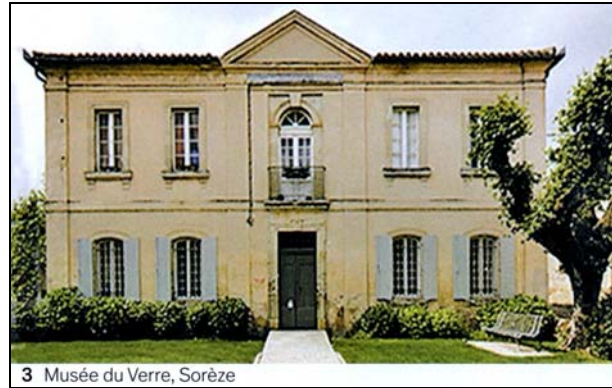
Abb. 2019/45-03; 3 Musée du Verre, Sorèze

Für Freunde der Glasmalerei und der Romanik ist die ehemalige Abteikirche Conques , nördlich des Languedoc einen Umweg wert. Hier hat der 1919 geborene französische Maler Pierre Soulages 1994 die Fenster der romanischen Kathedrale gestaltet. Die ausschließlich in feinen, grauweißen Tönen gehaltenen Fenster mit variierten schwarzen, grafischen Liniaturen erinnern an die introvertierten Alabasterfenster byzantinischer Kirchen in Ravenna . Der 1 ¾ Stunde südlich gelegenen Geburtsstadt des Künstlers Rodez vermachte der Künstler über 500 seiner Werke und Dokumente. Diese bildeten den Grundstock für ein 2009 realisiertes Museum, das seinen Namen trägt. Dort sind auch die originalen Entwürfe zu den Fenstern von Conques zu sehen.