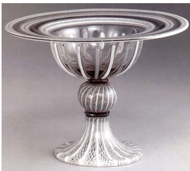
12 Tazza, Limoges Musée national de la porcelaine