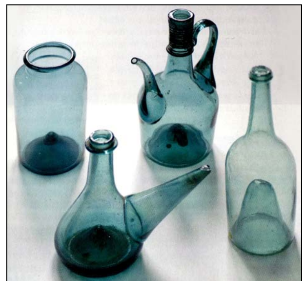
Abb. 2019/45-08 Gläser Musée du Verre, Lisle-sur-Tarn