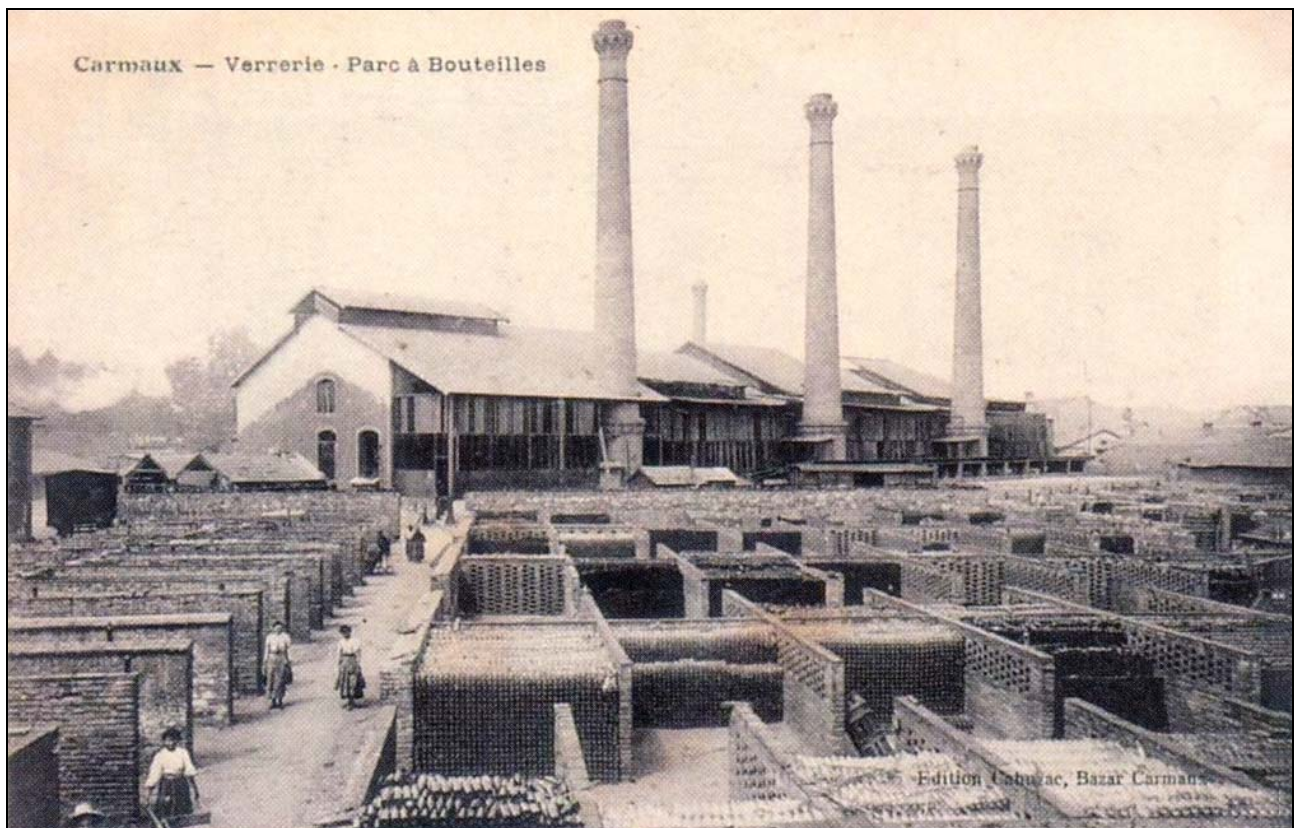
10 Glashütte Carmaux um 1908

10 Glashütte Carmaux um 1908 / Verrerie Parc à Bouteilles, Département Tarn, Region Okzitanien