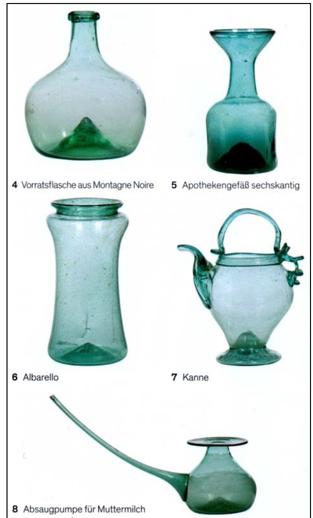
4 Vorratsflasche aus Montagne Noire 5 Apothekengefäß sechskantig