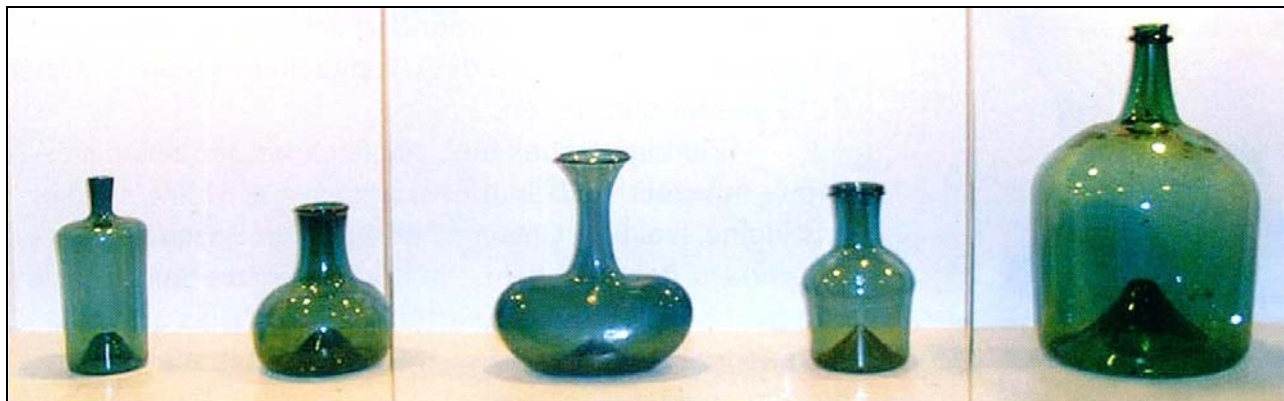
11 Glas der Grésigne im Musée d'art du verre de Carmaux.

11 Glas der Grésigne im Musée d'art du verre de Carmaux