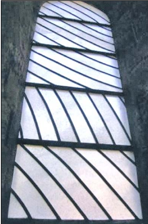
13 Conques Fenster von Pierre Soulages (1994)