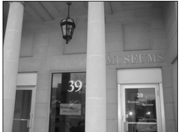
Meriden, CT, The Frank Chiarenza Museum of Glass