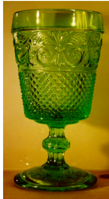
Abb. 2003-1/046b Fußbecher mit Ranken und Sternen Sammlung Schaudig eingepresste Marke „KIG INDONESIA“ am Boden der Kup- pa, Hersteller unbekannt

Abb. 1999/036 Fußbecher mit Ranken und Sternen Sammlung Geiselberger PG-345 (farbloses und) hellgrünes Glas, H 14,4 cm, D 7,4-7,5 cm Boden unten mit Ranken- und Sternen-Muster auf gekö- tem Grund Hersteller unbekannt sehr wahrscheinlich moderne Reproduktion, auch hellblau vgl. MB Launay, Hautin & Cie., Planche 47, Nr. 1736