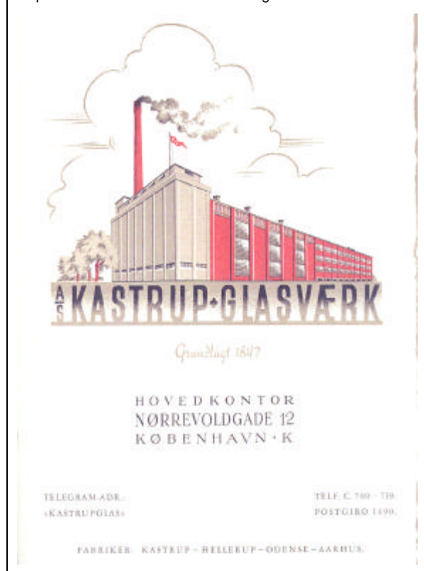
Abb. 2003-1-6/001 Musterbuch Kastrup / Fyens Glasværk 1950, Titelblatt Reprint Glashistorisk Selskab Aalborg 2001