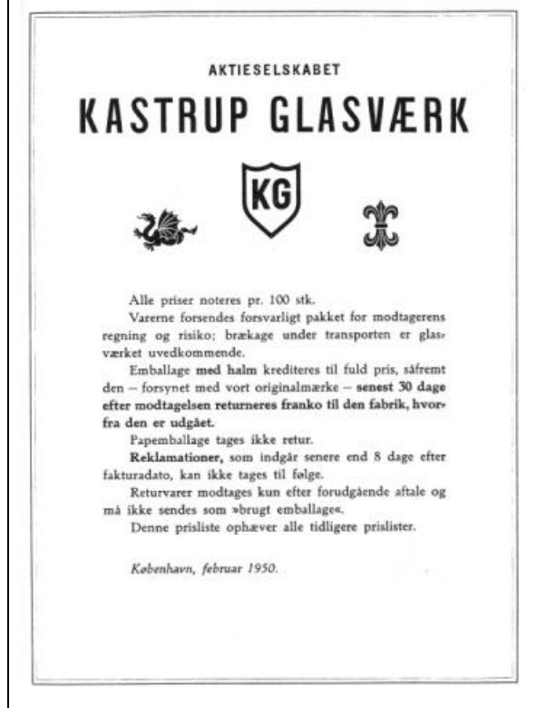
Abb. 2003-1-6/002a MB Kastrup / Fyens Glasværk 1950, Lieferbedingungen Reprint Glashistorisk Selskab Aalborg 2001