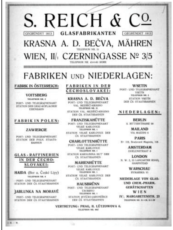
Abb. 2003-2-05/002 Pressglas-Kurant S. Reich & Co. 1925, Titelblatt Museum Valašské Meziříčí Inv.Nr. 60/03