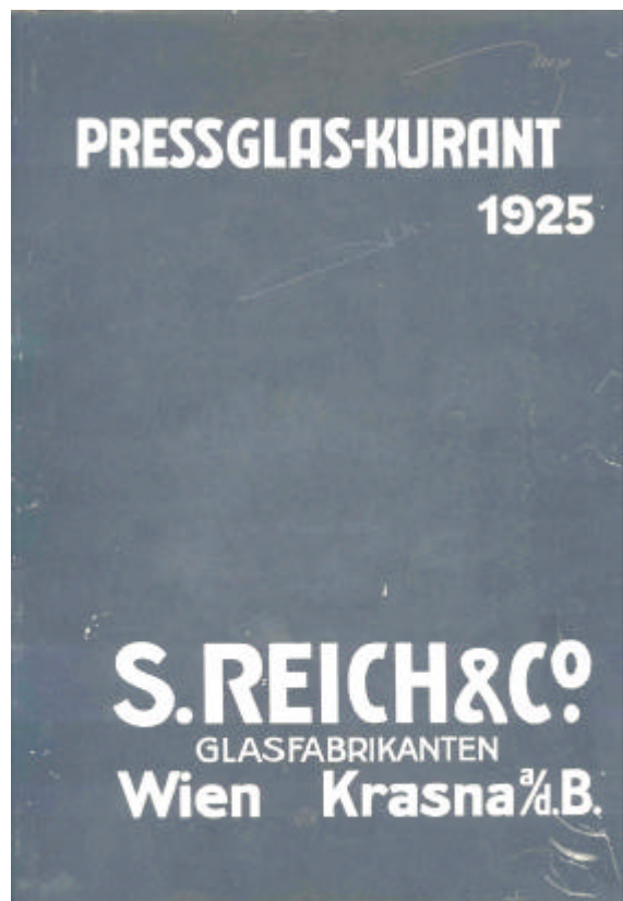
Abb. 2003-2-05/001 Pressglas-Kurant S. Reich & Co. 1925, Einband Museum Valašské Mezirící Inv.Nr. 60/03

Pressglas-Kurant 1925 S. Reich & Co. Glasfabrikanten Wien Krasna a/d.B.