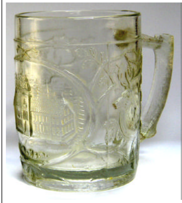
Abb. 2003-2-05/011 Kinderkanne m. Kleeblatt Sammlung OVM Vsetín / Valašské Mezířící s. Pressglas-Kurant S. Reich & Co. 1925, Tafel 5, Nr. 2923