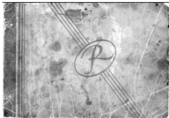
Abb. 2003-2-07/001 Musterbuch S. Reich & Co. ca. 1934, Einband Sammlung OVM Vsetín / Valašské Mezířící Inv.Nr. 77/03