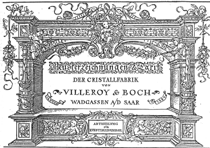
Abb. 2004-1-07/001 Musterbuch Villeroy & Boch 1884, Einband, Sammlung Valsaar