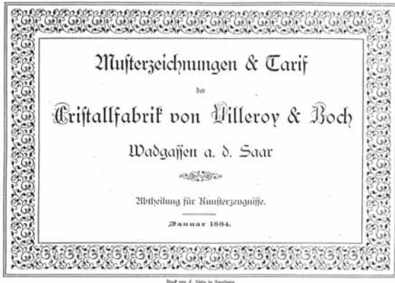
Abb. 2004-1-07/002 Musterbuch Villeroy & Boch 1884,. Titelblatt Sammlung Valsaar

u.a. Teller, Untersätze, Zuckerdosen, Zuckerschalen, Likör-Service Carolina