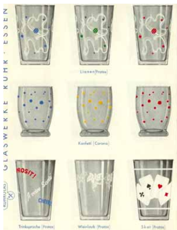
Abb. 2005-1-18/004 MB Ruhrglas um 1955, Tafel 3, Becher Sammlung Wolf