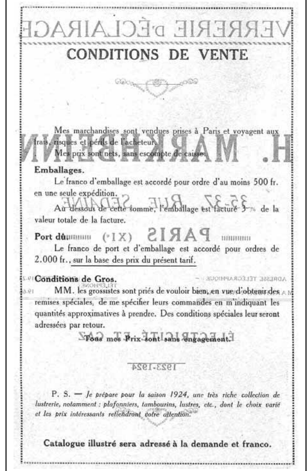
Abb. 2005-2-04/002 MB Markhbeinn 1923 B, Verkaufs-, Lieferungs- und Zahlungsbedingungen