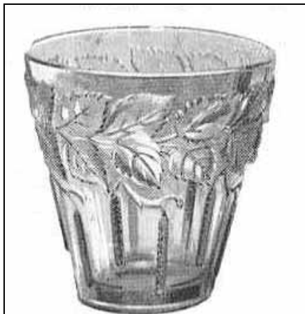
11103, Beau Vase Moderne Relief "Feuilles"

Vase mit (Birken- oder Erlen-)Blättern farbloses Pressglas, mattiert, H 16,5 cm, D 16,5 cm auch rauchgrau, bernstein, amethyst, opaline MB Markhbeinn 1936, Pl. 54, Nr. 11103 MB Markhbeinn 1935, Pl. 39, Nr. 11103 MB Markhbeinn 1934, Pl. 17 u. 18, Nr. 11103 vgl. Sammlung Stopfer, Abb. 2003-3/192 Josef Inwald, Teplice, um 1935 vgl. Abb. 2003-4-12/001 MB Inwald 1934, Tafel 155, Vase Nr. 11103 Tafel 157, Vasen Nr. 11149 B u. C Tafel 156, Vasen Nr. 11134 u. 11135