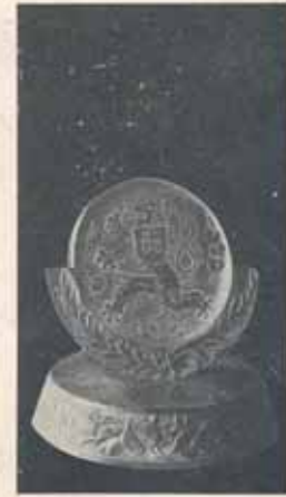
1517. Plaketa z kt. skla reliéfne rytá, Ø 7 cm, výška 11 cm. Kės 135.—, zasazená v umělecky řezaném podstavci s odbohem listových řízů. Věnování na druhé straně plakety