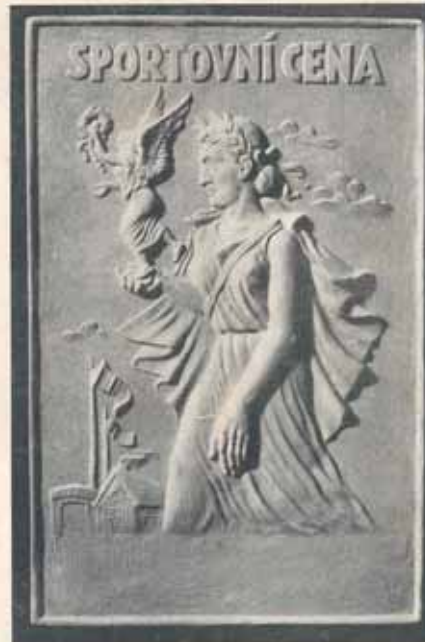
1510. Viz č. 1508.