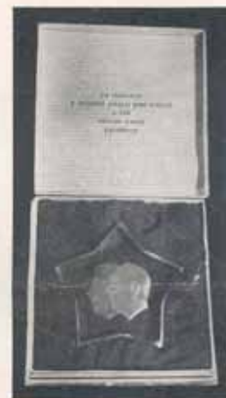
1511—1512. Plakety z křehálá, skla, reliefně pracované, se lvem nebo portrety generalis, Stalina a p. presidenta Dra Ed. Beneše velikost 7 cm, Kės 45—, kaseta 8x8 cm Kės 20—, nápis do víčka kasety, tišibný za Kės 5.—. Viz vzor 991—992.