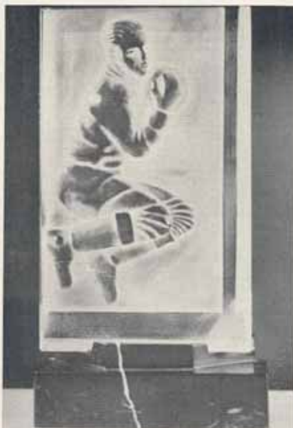
1507. Křehálávká plaketa dle návrhu prof. O. Žáka, hodící se pro kopanou nebo házenou. Výška 29 cm, šířka 12 cm, váha 2 kg, Kės 550—, mramorový podstavec Kės 150—, dřevěný podstavec Kės 80— Tyto plakety máme s figurou pro všechny druhy sportu