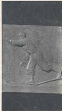
1514. Reliéfne rytá plaketa z křišťálového skla s lyžařem. Kės 380.—, podstavec 100.—. Na místo podstavce možno plakety zhotovit též do etue

Zhotovíme Vám plakety v různých rozměrech. Sdělte nám své přání. Pošleme Vám obratem nabídku.