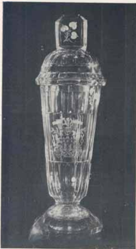
1504. Tříký masivní pohár z olovnatého křehálá se znakem, figurou a věnováním, které je vyryto na pásu hořejšího víka. Výška 50 cm Kės 4.700—

Zhotovíme Vám plakety v různých rozměrech. Sdělte nám své přání, pošleme Vám obratem nabídku.